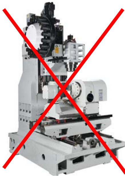
Figura 02: Sistema de movimentação dos eixos “X, Y e Z”.

Modelo construído com base em mesa móvel.